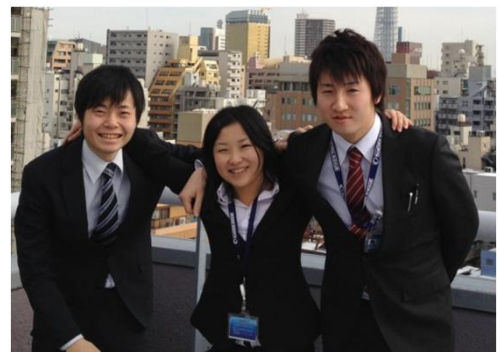
(2012年入社メンバー 現在活躍中です)